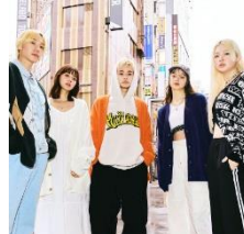
WEGO YOUR FAN