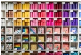
flying tiger copenhagen