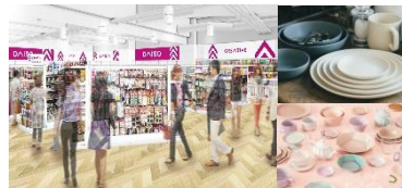
DAISO ダイソー Standard Products THREEPPY