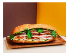
BANH MI XIN CHAO バインミーシンチャオ