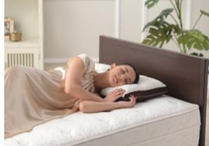
B-DESIGN by じぶんまくら