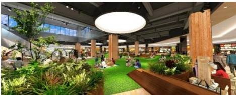
「ピクニックコート」