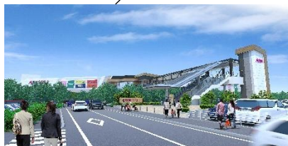
「西側平面駐車場とつながる 連絡ブリッジを新設」