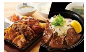
牛角 Gyu-Kaku 焼肉食堂