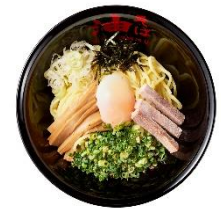
油そば 東京油組総本店