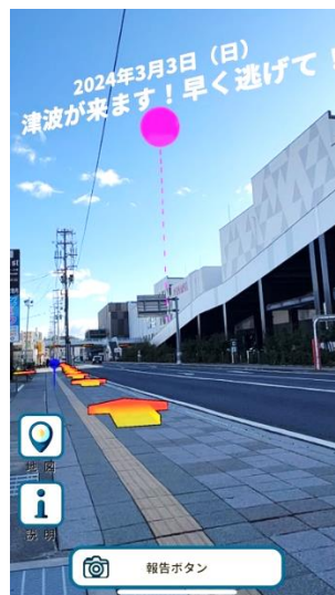
図1：避難を支援する実空間メタバースのスマホアプリ画面

実空間に情報を付与する実空間メタバースを、カメラに写った画像から正確にカメラの位置や向きを特定する Visual Positioning System により実現し、スマホアプリとして提供します。