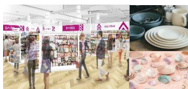
DAISO ダイソー Standard Products THREEPPY