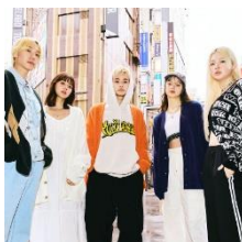
WEGO YOUR FAN