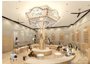
CAT CAFE MOCHA