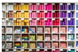
flying tiger copenhagen