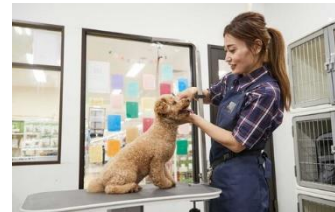
PETEMO PETLIFE STORE