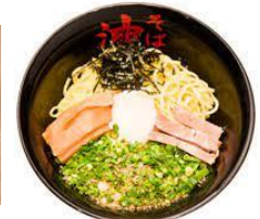
油そば 東京油組総本店