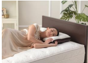
B-DESIGN by じぶんまくら