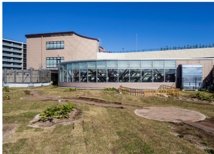
【イオンモール多摩平の森の屋上のビオトープ】

（※2）OECM（Other Effective area-based Conservation Measures）：民間等の取り組みにより生物多様性保全に貢献している里地里山や企業林など、保護地域以外の土地・地域のこと。