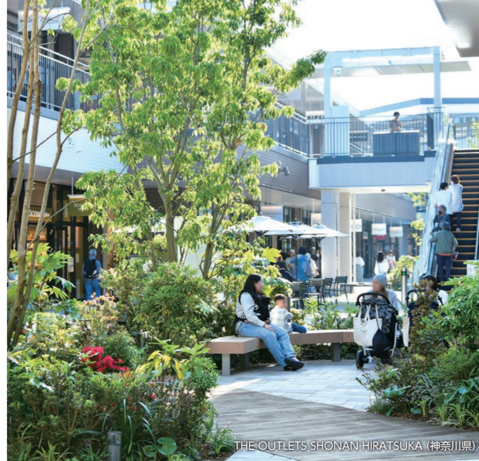
THE OUTLETS SHONAN HIRATSUKA (神奈川県)