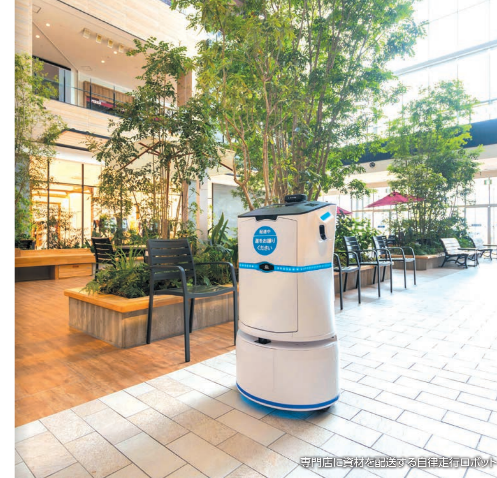
専門店に資材を配送する自律走行ロボット