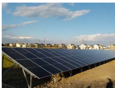
<低圧・分散型太陽光発電設備>