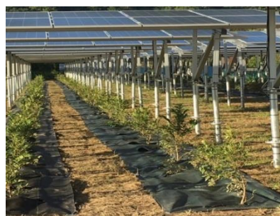
<ソーラーシェアリング>

また当社は2040年目標達成に向けた今後の課題として、再エネ自給率の引き上げを掲げており、この度2030年度までの具体的数値目標およびアクションを定めました。