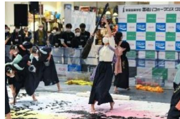
【第1回 全国高等学校書道パフォーマンスグランプリの様子】