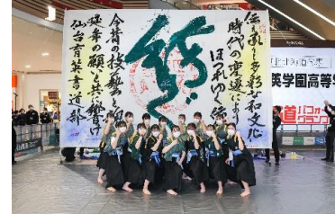
【第1回大会優勝校 仙台育英学園高等学校】