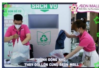
【ベトナム】 小型家電の回収、衣料品や本の回収「緑のワードロップ」を実施。