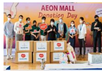
【インドネシア・カンボジア】 4/22「アースデー」に合わせ、ドネーション企画を実施。

当社では、2030年までに取り組むべき地球規模の17の目標“SDGs”に向けて、全社を挙げて取り組んでいます。今回の取組が該当する開発目標は、下記の通りです。