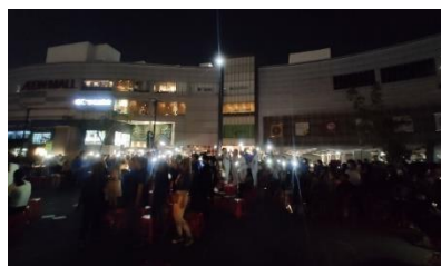
【ベトナム】 3月26日の「アースアワー」に館内外照明の一部を消灯。