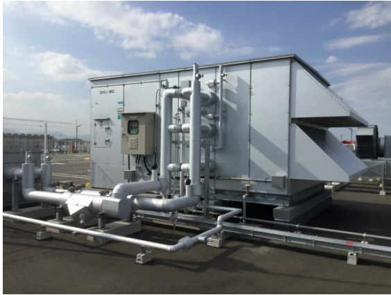
<インバーター制御の外調機>