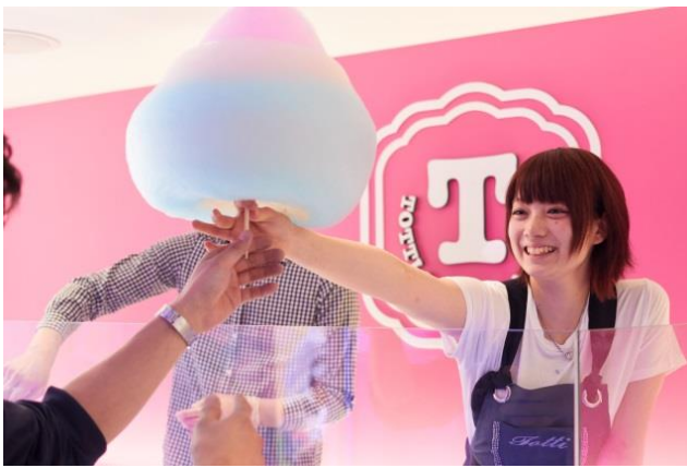
【TOTTI CANDY FACTORY】