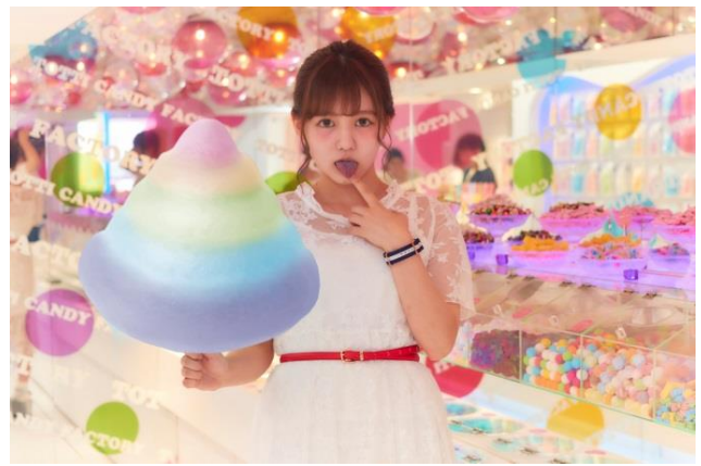
【TOTTI CANDY FACTORY】