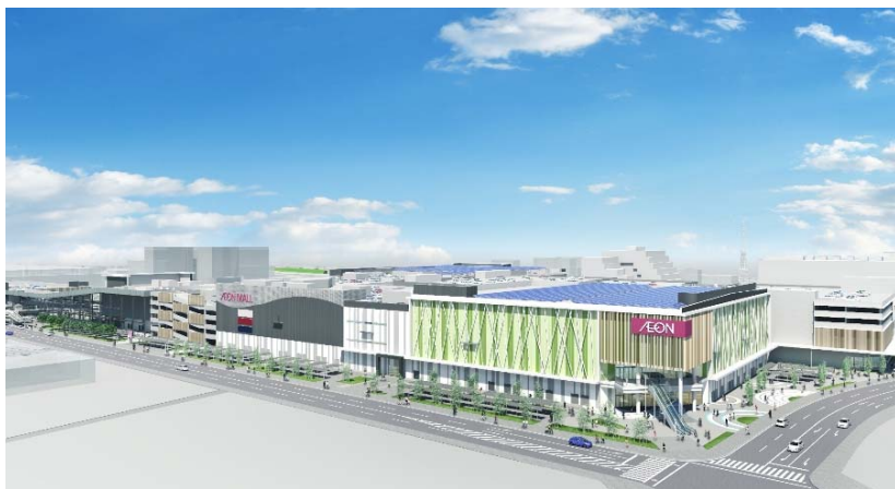
向日市(南西)側からみたモール