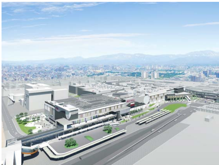
京都市(北東)側からみたモール