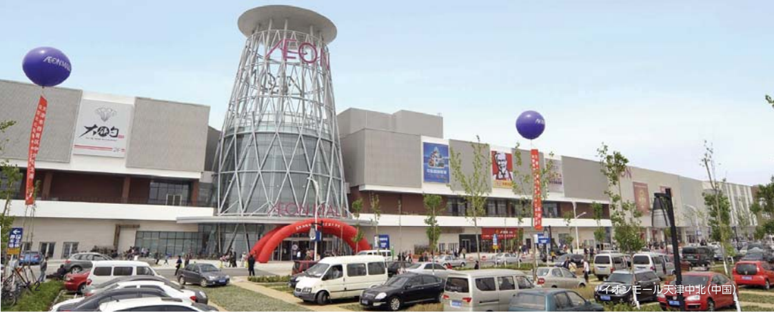
イオンモール天津中北(中国)