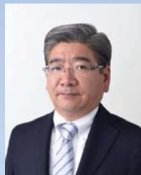
イオンモール株式会社 代表取締役社長

このCSRレポート『未来への報告書』で、私たちがつくる「まち」の現在とこれらについてご報告いたします。引き続きご支援・ご協力を賜りますよう、よろしく願い申し上げます。