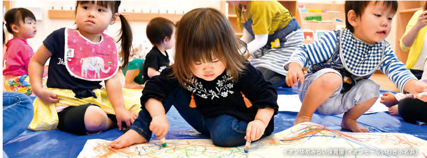
イオンゆめみらい保育園[イオンモールいわき小名浜]

私たちは、専門店で勤務する方も、当社の従業員も、「ずっとイオンモールで働きたい」と思える職場環境づくりを推進しています。