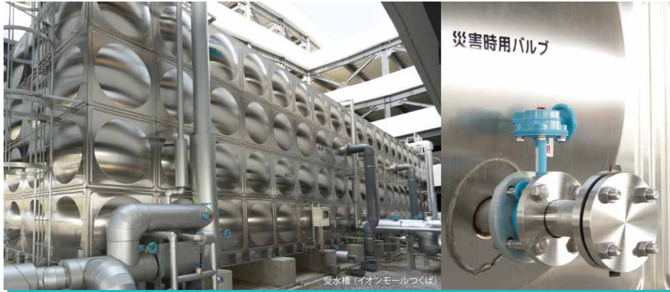
受水槽 (イオンモールつくば)

私たちは関わりのあるすべての人たちに対して、さまざまな安全を提供し、どんなときも安心の評価をいただけるまちづくりを推進します。