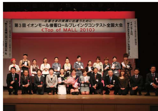
大会テーマは「お客さまの笑顔に出逢うために」。コンテストには幅広い業種の従業員が参加します。