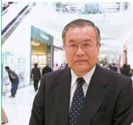
2004年6月 イオンモール株式会社 代表取締役社長

「地域」: イオンは、地域の暮らしに根ざし、 地域社会に貢献し続ける 企業集団です。