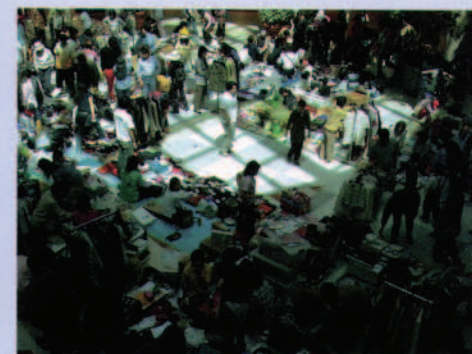
SC内でのフリーマーケットの開催 敷地を利用してのフリーマーケットなど、地域の人々と交流するさまざまなイベントを行っています(秋田SC)