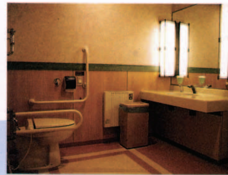
みんなのトイレ 車イスのお客様でも楽に利用できるよう設計されています

すべてのお客様の満足をめざし、お年寄りや子どもはもちろん、ハンディキャップを持った方、妊婦の方など、誰もが楽しめるショッピングセンターづくりを進めています。ショッピングだけでなくさまざまな機能やアメニティを提供する空間だからこそ、駐車場、売場、通路、エレベーターからトイレまで、すべての施設を快適にご利用いただくための配慮を大切にしています。お買い物支援サービスや、いつでも声をかけていただけるよう入り口にインターホンを設置するなどの取り組みを行い、多くのショッピングセンターで「ハートビル法」（高齢者・身障者の方々が円滑に利用できる建築に関する法律）の適用を受けています。下田SCには全国初のショッピングセンター内デイサービス（通所養護）センターを設けました。また、自治体のパンフレットをそろえた情報プラザコーナーを設置するなど行政サービスの情報も複数のショッピングセンターで提供しています。