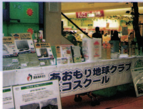
自治体の環境活動を支援 県主催の「あおもり地球クラブ エコスクール」の開催など、こどもエコスクールの活動を支援しています(下田SC)