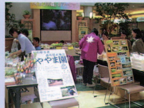
地域に開かれた施設として 地域の福祉団体の活動にスペースを提供しています(三光SC)