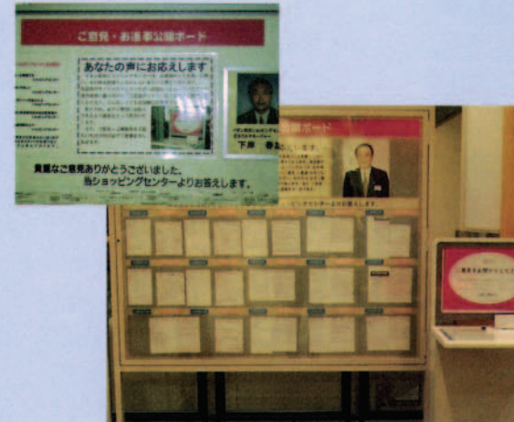
ご意見・お返事公開ボードと承りBox (秋田・岡崎SC)

各ショッピングセンターの店頭には、お客さまのご意見やご要望をお寄せいただく「ご意見・お返事公開ボード」を設置し、いただいたご意見はすべて回答させていただいています。利用されるお客さまの視点からのご意見はショッピングセンターの運営やサービス、テナントさま商品の品揃えなどへの貴重なアドバイスとさせていただきます。