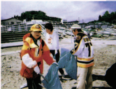
「クリーン&グリーン」活動 従業員がボランティアでショッピングセンター周辺を定期的に清掃しています