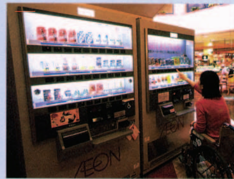
バリアフリーの自動販売機の設置 ボタンや取出口の位置が工夫され、誰もが簡単に使えるように改善されています