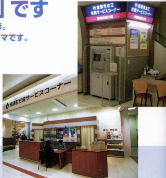
行政サービス 住民票の写し、印鑑登録証明書の交付などお客さまの利便性を高めています(東浦・倉敷SC)

子どもたちの学習の場や、市民のサークル活動の拠点としても機能するコミュニティの中核施設、それがショッピングセンターの役割です。市民のサークルや福祉団体などに活動の場と機会を提供したり、自治体行政サービスの出先機関をはじめ、銀行、医療施設といった公共性の高い機能も合わせ持つなど、いつも、人が集う真ん中に位置したいと願っています。