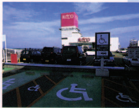
車イスのお客様専用駐車場 スムーズに乗り降りができるよう、ゆとりあるスペースを確保しています