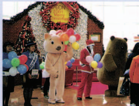
店頭での募金活動 「赤い羽根」共同募金活動を実施しています