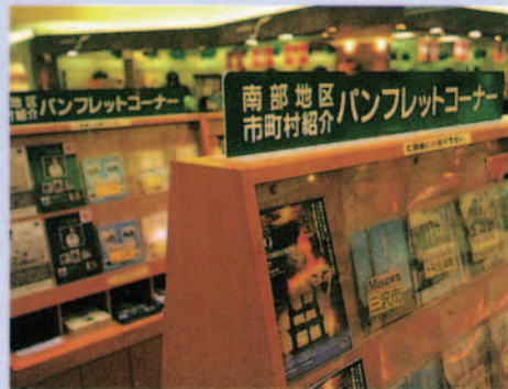
各種の情報を発信 ショッピング時に観光案内などコミュニティ情報も入手していただけます