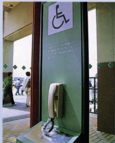
インターホンを入口に設置 お買い物支援サービスをご希望のお客様にご利用いただいています