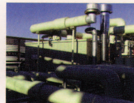
排ガス排熱投入型吸収冷水機 (大和SC)