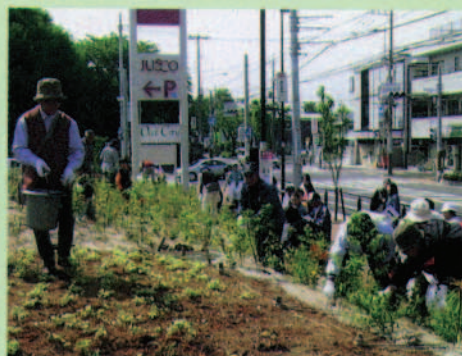
「みどりの日」の育樹祭 (大和SC)