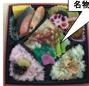
【旭川うまいっしょ弁当】