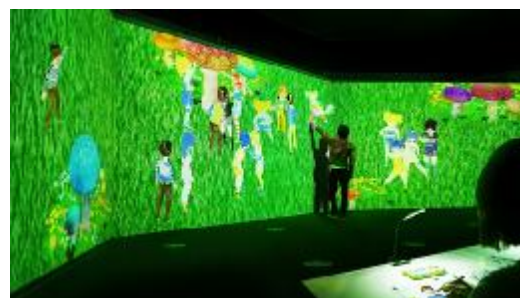
参考：「チームラボ お絵かきピープル」