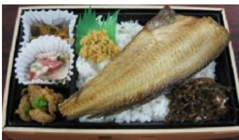
【男山酒造漬魚弁当】

養豚が盛んな旭川ならではのB級グルメ「ホルモン醤油焼きそば」をはじめ、旭川の老舗男山酒造「男山」の酒粕で漬け込んだ漬魚を使用した「男山酒造の漬魚弁当」、地元名物“とんとろ丼”や近郊野菜などを使用した「旭川うまいっしょ弁当」を取り揃えます。地域にお住まいのお客さまはもちろん、観光で訪れる方々にも道北の食の魅力を発信します。