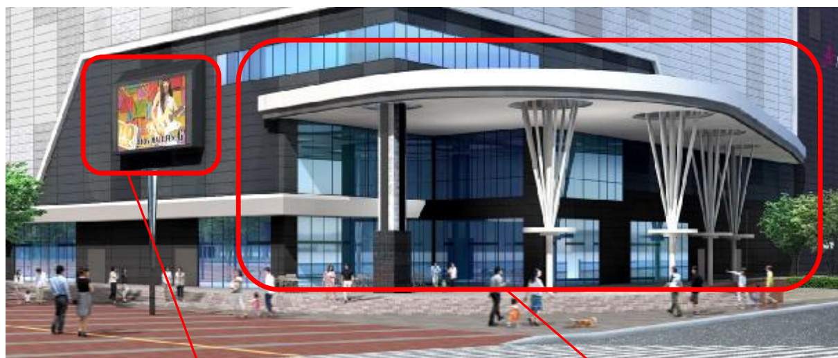
デジタルビジョン

当モールのメインエントランスへ誘う大きく突き出た庇は、平和通買物公園との連動を演出し、駅と平和通買物公園をつなぐ地域の新たなシンボルとして皆さまをお迎えします。