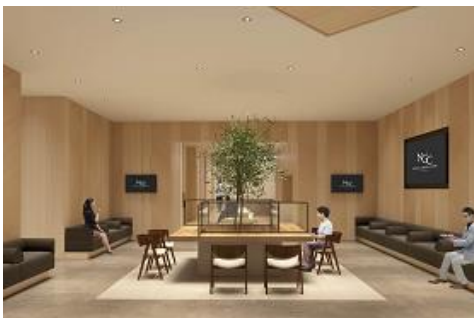
外来診療／待合スペース