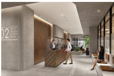
人間ドック・健診／受付