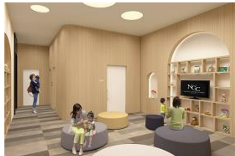
小児科／待合スペース