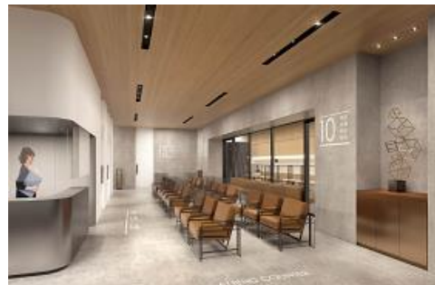
人間ドック・健診／待合スペース