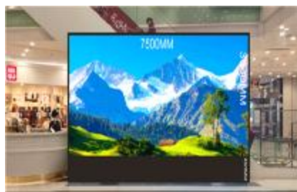
中央広場デジタルサイネージ