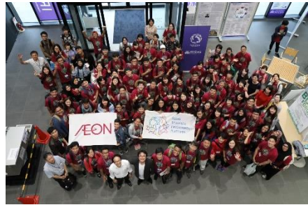
東北大学災害科学国際研究所にて

ASEP は、2012年から毎年実施しており、アジア各国の大学生が集い、各国の自然環境や価値観の違いを学びながら、地球環境問題について討議を行う取り組みです。第6回の2017年は日本で開催され、8カ国8大学64名の大学生が「生物多様性と再生」というテーマのもと、東北の被災地を中心にフィールドワークを行いました。その中で亶理町で震災を経験した高校生・大学生とともに植樹を行うとともに、東北大学災害科学国際研究所において史料保全修復体験と減災について学びました。