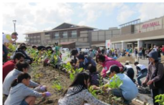
2015年の「イオン ふるさとの森づくり」植樹祭の様子

※算定基準詳細 : https://www.pref.okinawa.jp/site/kankyo/saisei/ryokuka/documents/santeiki_jyun.pdf