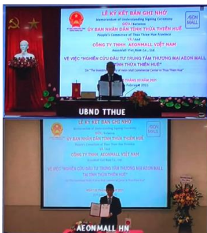
* Covid-19の影響によりオンラインで調印式を開催。