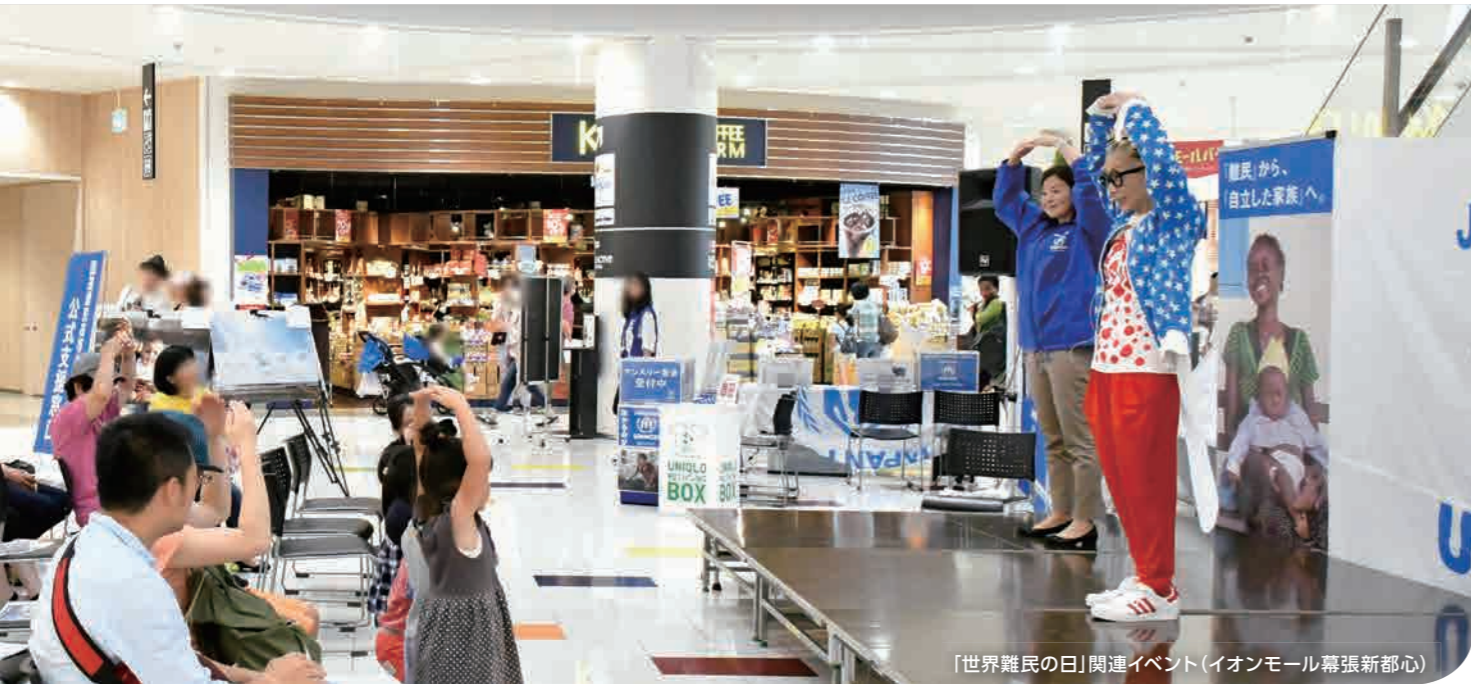
「世界難民の日」関連イベント(イオンモール幕張新都心)

私たちは人々が求める真の貢献を実現するために、その地域に密着し、交流を深めることで問題を共有し、その解決に努めます。