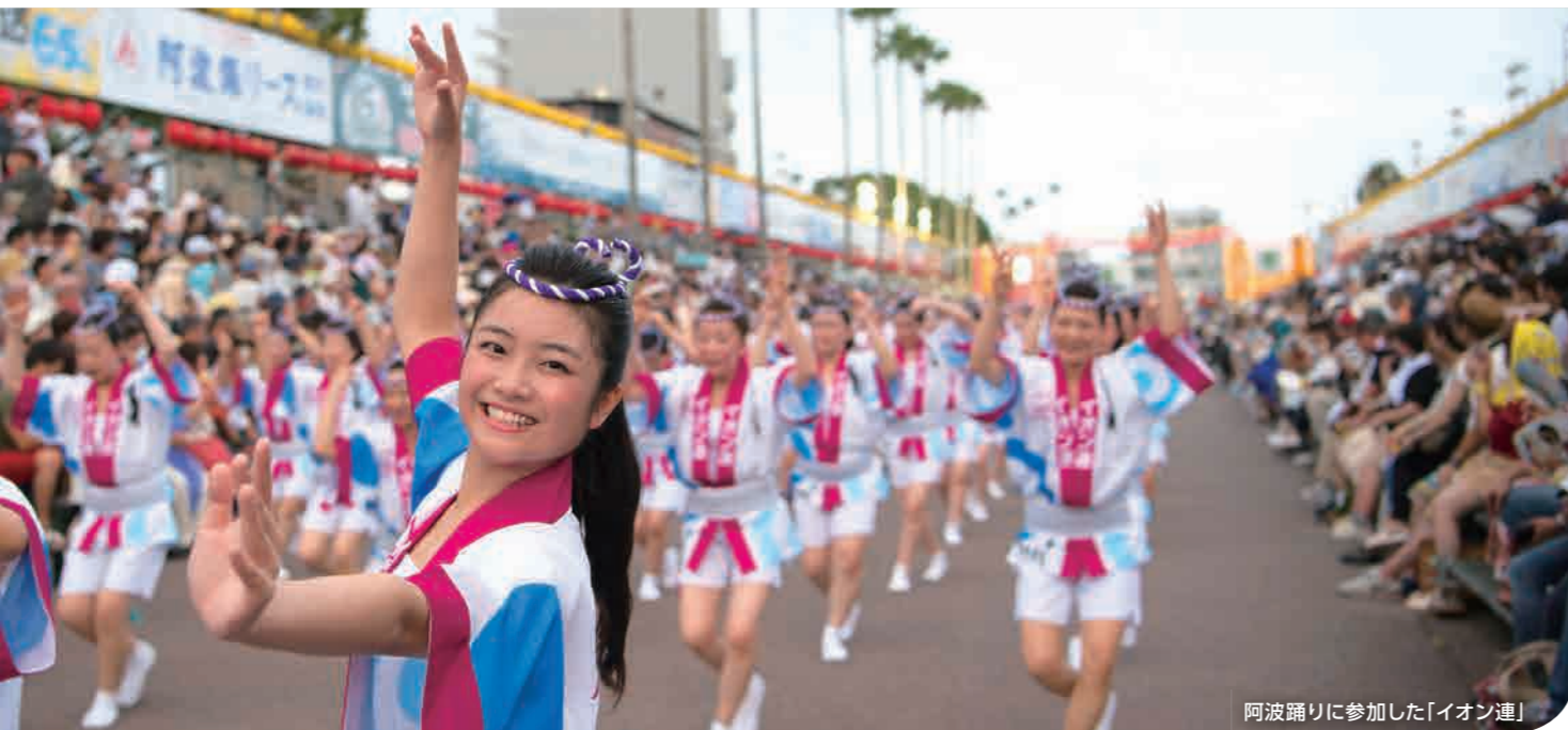
阿波踊りに参加した「イオン連」

私たちは人々が求める真の貢献を実現するために、その地域に密着し、交流を深めることで問題を共有し、その解決に努めます。