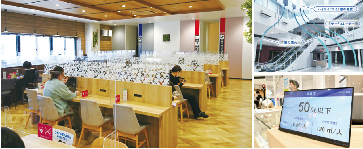
左：在员工休息室内，所有座位都设置了亚克力板以防止飞沫传播，除此之外，还配备了大型空气净化器进行通风（永旺梦乐城新利府南馆：宫城县） 右上：利用通风系统加强空气循环 右下：利用来馆人数计数系统防止馆内过度拥挤