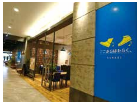
职业介绍所 THE OUTLETS HIROSHIMA[广岛县]