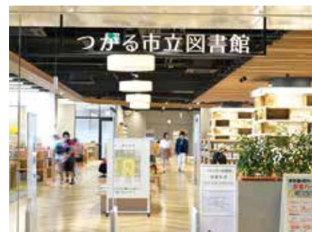
市立图书馆 永旺梦乐城津轻柏店[青森县]