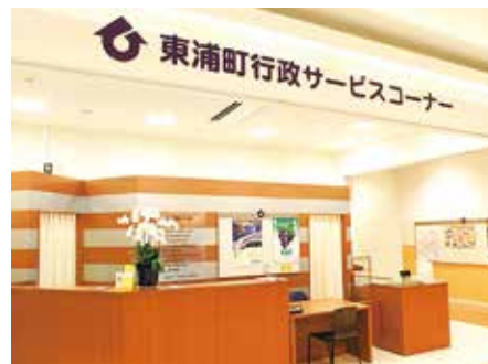
行政专柜 永旺梦乐城东浦店[爱知县]