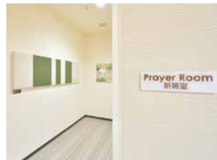
祈祷室 永旺梦乐城冲绳来客梦[冲绳县]