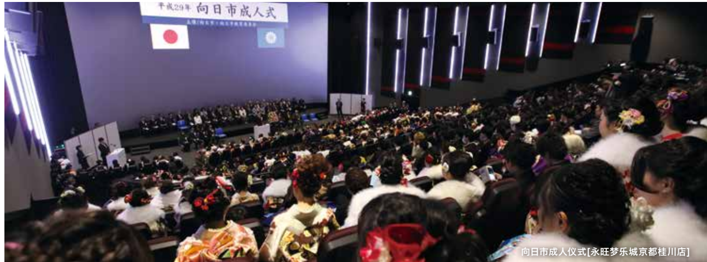
向日市成人仪式[永旺梦乐城京都桂川店]