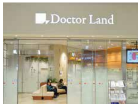
综合诊所 永旺梦乐城幕张新都心店[千叶县]