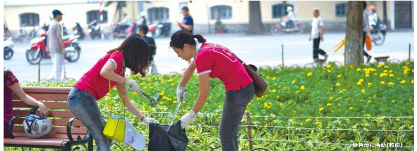
绿色清扫活动[越南]

为了作出真正贡献，我们加深与地区社会及各种团体之间交流，致力于分享问题、解决问题。