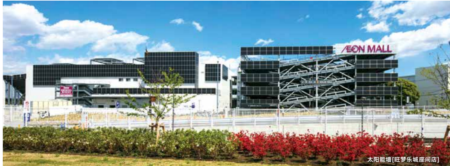
太阳能墙[旺梦乐城座间店]

我们积极引进最新技术，灵活利用自然能源并降低环境负荷，加速推进与地区环境和谐共存的城市建设步伐。