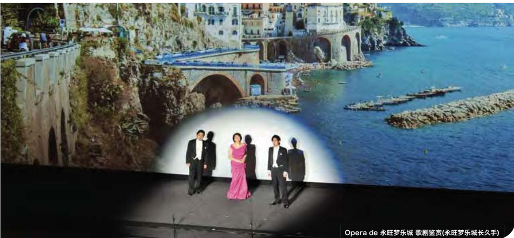
Opera de 永旺梦乐城 歌剧鉴赏(永旺梦乐城长久手)