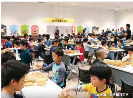
日本全国儿童将棋冠军赛