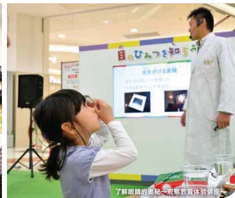
了解眼睛的奥秘~观察教育体验讲座~