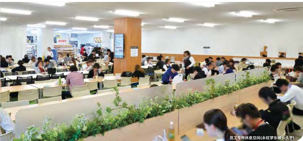
员工专用休息空间(永旺梦乐城长久手)

日本社会面临着雇佣难和离职率不断上升等人才不足的社会问题,为了打造一个可长期工作的职场环境,我们全力致力于提高在永旺梦乐城中开店的专卖店员工的ES(店员满意度)。