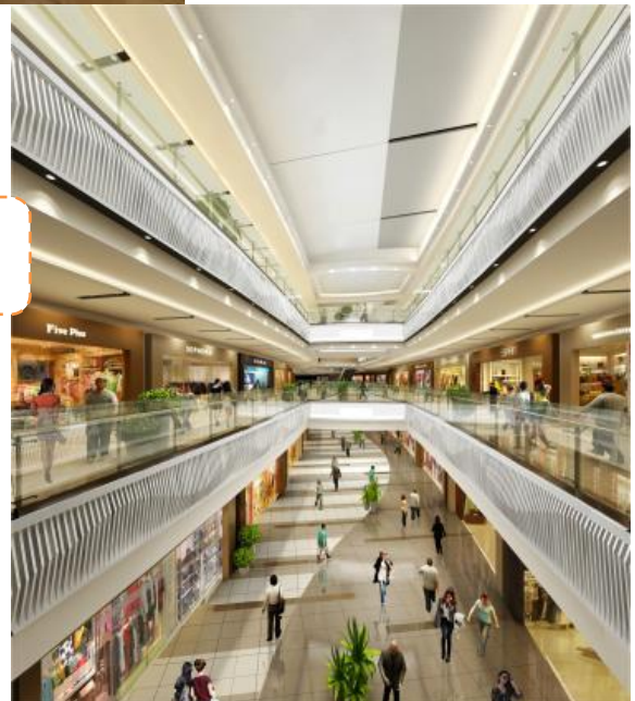
象征着海岸线的 “中庭 (Main mall)”