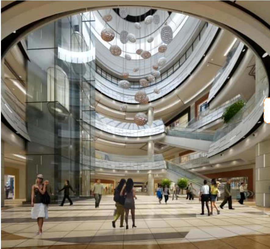
以海浪为形象设计的 “迎宾广场 (Welcome Court)”

本购物中心周边是完善的美丽海岸和公园，该地区是游览胜地，夏季来临时有很多游客前来游玩。本购物中心意识到要灵活发挥地域优势，以“耳目一新的海岸线”为关键词进行了设计。在购物中心内可以将“沙滩”、“港湾”、“波浪”、“岩石”等关于海岸构成元素转化为建筑要素，并将其组合在一起，让客人感受到“烟台”，同时也提供了可乐享其中的非日常生活的空间。