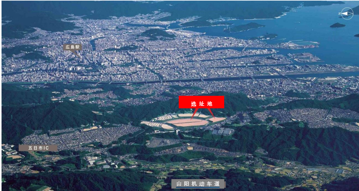
航空照片 (2015年10月拍摄)