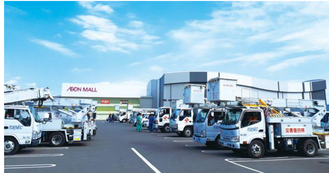
永旺梦乐城木更津（千叶县）