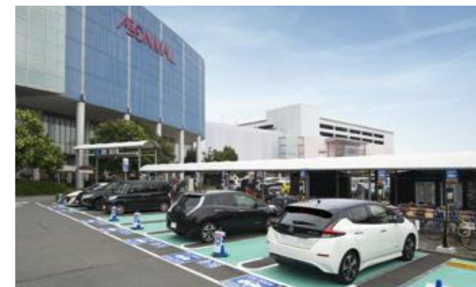
永旺梦乐城武藏村山（东京都）

自2008年起，本公司以保护地球环境、实现社会的可持续发展为目标，为了加速二氧化碳零排放电动汽车及插电式混合动力汽车的普及，在各个购物中心继续扩大EV充电器的设置范围。截至2020年2月末，除了已在日本国内的138家购物中心内建立了共1,837台充电设备以外，还在中国的14家购物中心设置了564台、在东南亚地区的2家购物中心设置了3台。此外，AEON MALL Ha Dong（越南）共设有20台电动摩托充电器。