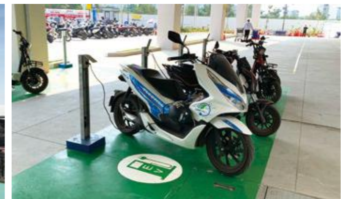
AEON MALL Ha Dong（越南）