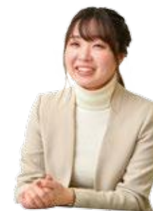
永旺梦乐城新居滨 运营 长岛 实穗