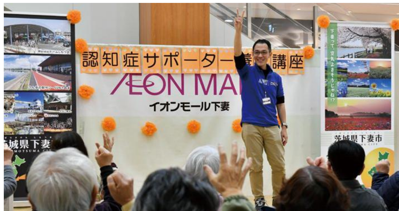
永旺梦乐城下妻（茨城县）