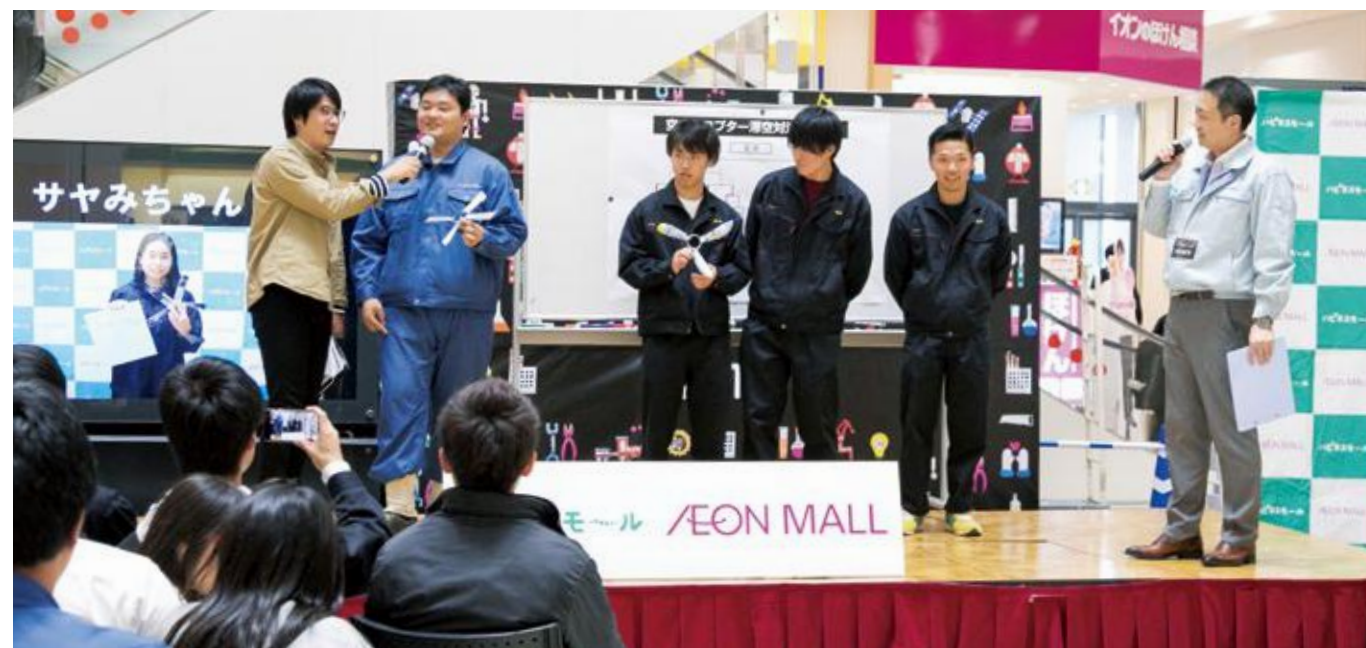
永旺梦乐城新居滨（爱媛县）