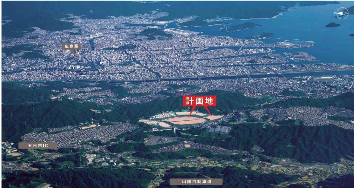
航空写真（2015年10月撮影）