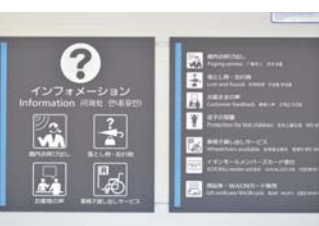
设置日文、英语、中文(简体字·繁体字)、韩文版标志。