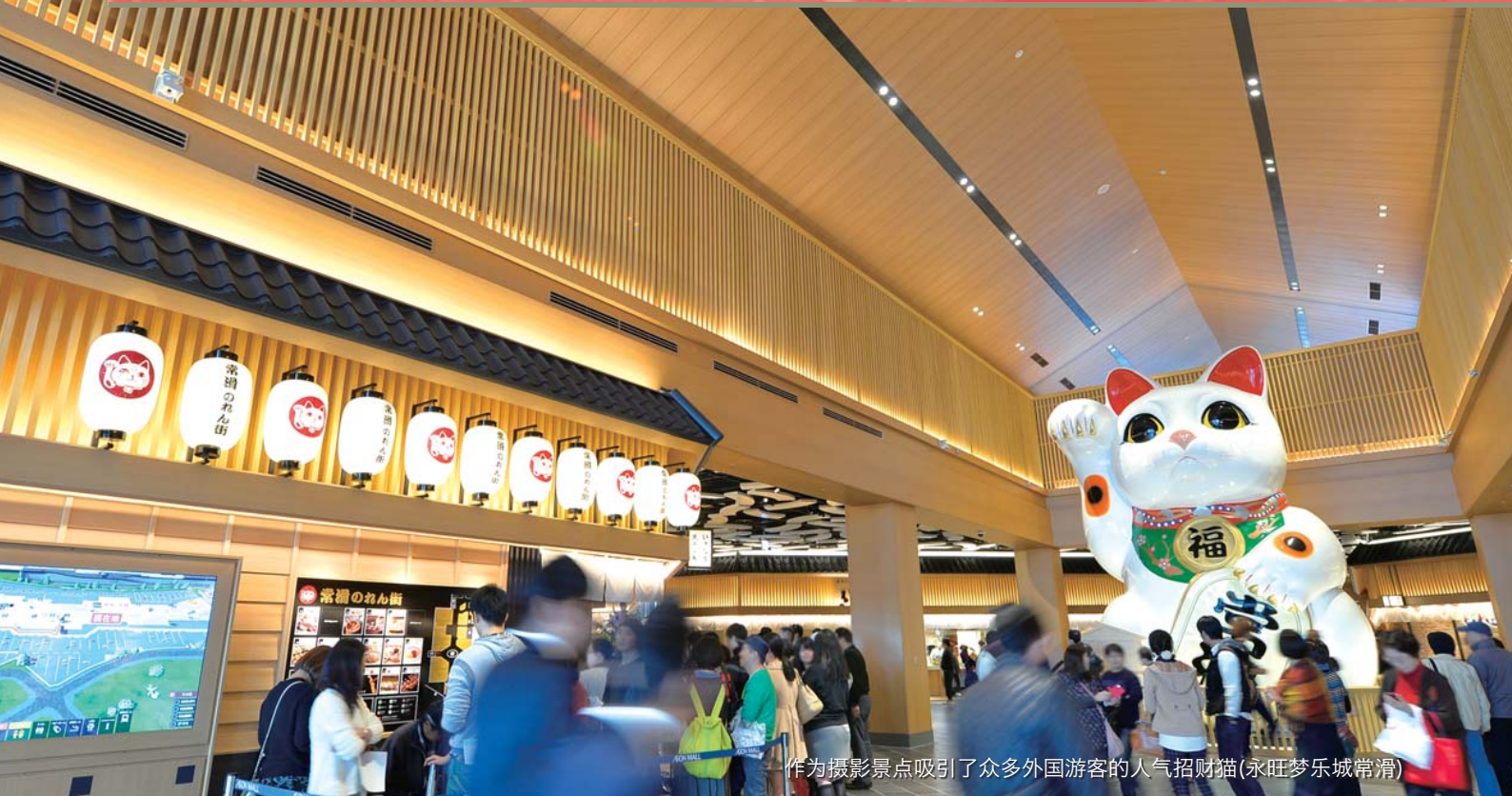
作为摄影景点吸引了众多外国游客的人气招财猫(永旺梦乐城常滑)

访日外国游客日益增长，2015年约达1,973万人次。 全国各地的永旺梦乐城也吸引了无数的外国顾客，我们将采取各种措施，为他们提供一个可轻松进店、放心购物和尽情用餐。