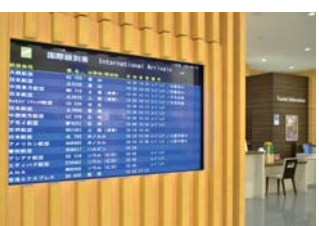
馆内可确认中部国际机场的国内外出发信息，出发前也可放心购物。