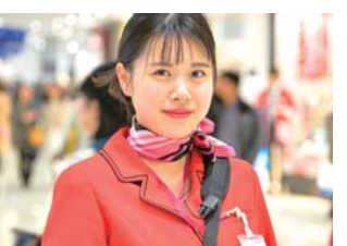
精通各种语言的“移动信息中心”服务人员馆内巡回，为顾客进行各种指南。

虽然有些员工认为语言障碍使服务变得困难，但是其实顾客对于语言不通本身并不是很在意。我认为无需过于在意语言问题，以接待日本顾客的方式自然迎接即可。在餐饮店方面，我们还与各大专卖店商榷，能否推出适用于素食顾客的菜单等。