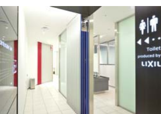
和与常滑具有深厚渊源的(株)LIXIL公司合作，采用日本号称享誉世界的最新款式卫生间。