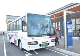
机场与购物中心之间运行约需15分钟即可抵达的直通免费迎送大巴。周六/周日/假日将会增加班次。